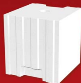
SENDWIX 8DF-LD 248x240x248