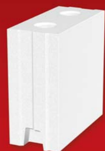
SENDWIX 4DF-LD 248x115x248