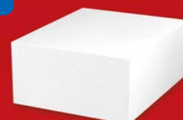
SENDWIX 5DF-LP 290x240x123