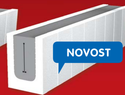
SENDWIX PREKLADA 6DF 175x240x1000-3000