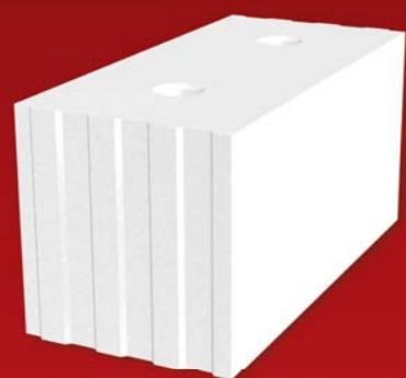
SENDWIX 16DF-LD 498x240x248