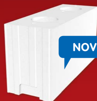
SENDWIX 12DF-LD 498x175x248