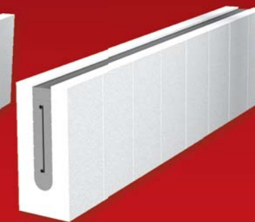
SENDWIX PREKLADA 2DF 115x240x1000-3000