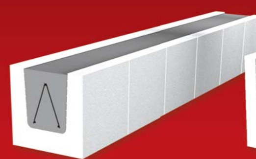
SENDWIX PREKLADA 8DF 240x240x1000-3000