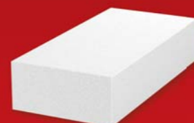
Zgornja opeka VF 290x140x65