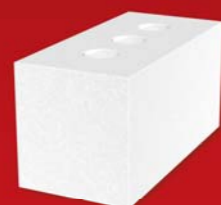
SENDWIX 2DF-LD 240x115x123