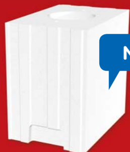
SENDWIX 6DF-LD 248x175x248